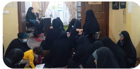
سلسله نشست های زنان و خانواده