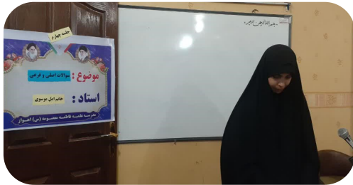
کارگاه ۱۰ جلسه ای روش تحقیق