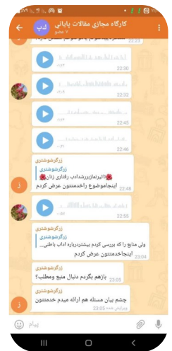
کارگاه مجازی مقاله نویسی