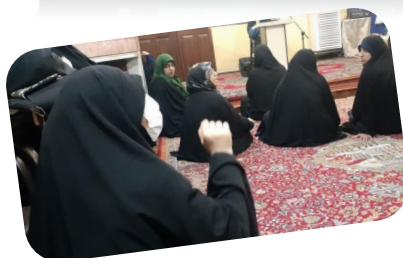
کرسی آزاد اندیشی