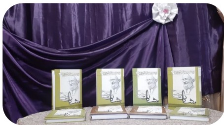
ایستگاه آثار شناسی