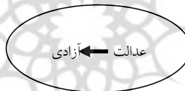
شکل ۲. نسبت عدالت و آزادی در صورت ترتب آزادی بر حق

۲. اگر آزادی را مترتب بر حق بدانیم آنگاه هر جا که حقی اعطاء می‌شود به تبع آن آزادی‌ای نیز اعطاء می‌شود؛ یعنی آزادی مترتب بر عدالت و متاخر از آن خواهد بود که با تحقق عدالت لزوماً محقق می‌شود. البته همان‌گونه که از متن فوق برداشت می‌شود ترجیح اولیه ایشان این است که آزادی متاخر از مفهوم حق یا به تعبیر دیگر از نتایج حق است.