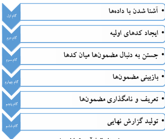
نمودار ۲: فرآیند تحلیل مضمون

۶- تولید گزارش نهایی (بروان و کلارک، ۲۰۰۶: ۷۷ تا ۱۰۱).