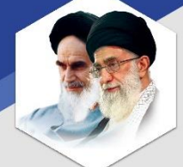
و من الله توفیق زهرا نهجودی

بی شک حماسه روحانیون و زنان مجاهد در دوران دفاع مقدس از آنهان پاک نخواهد شد و تعهد، ایمان، ایثار و دفاع از دین و مکتب شیع ریز به روز توسط نسل های امروز و آینده به قدرت و پایداری هرچه بیشتر خواهد رسید. حوزه علمیه خواجهران، امروز نیز با پاسداری از مکتب اسلام، مانند دیروز در صحنه دفاع از دین و عقیده حاضر است و روشنی‌بخش شمع محلی است که میزبان و دعوت کننده‌اش حضرت خمینی مرتبت محمد مصطفی صلی الله علیه و آله و سلم است. مدرسه فاطمه معصومه... در راستای پیوند هر چه بیشتر طالب علوم دینی با حقاری دوران دفاع مقدس و ترویج فرهنگ ایثار و شهادت و پذیرش سخنی در راه دفاع از دین، در تلاش است به سفارش مقام معظم رهبری بر سر طلیعه دار سپاه معظران- با ارائه طرح هایی از قبیل تربیت نویسندگان و داستان‌نویسان دفاع مقدس و مسائل مربوط به آن، برگزاری سیرهای مطالعاتی و فراهم آوردن معاملی در جهت نائل و تعیین تفکر ابتکارگرانه و انطباق آن با وظایف امروز جوانان، در جهت ارتقای فرهنگ ناپ شهادت گامی هر چند کوچک بردارد. امید است با عنایت پروردگار و دعای حضرت ولی عصر (عج) تمامی فعالین عرصه قلم در پیشبرد اهداف اسلام عزیز حماسه آفرین باشند.