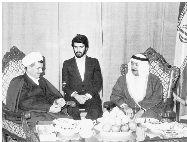
دیدار وزیر خارجه امارات با رئیس مجلس شورای اسلامی

رئیس مجلس شورای اسلامی افزود: «حزب بعث عراق ماهیتاً نمی‌تواند با اسلام سازگار باشد، شما می‌دانید که آنها ایدئولوژی اسلامی ندارند، بلکه ضداسلام هستند. کشورهای ضد اسلامی در جاهای دیگر وجود دارند، اما در منطقه اسلامی وجود یک رژیم ضد اسلام صحیح نیست.