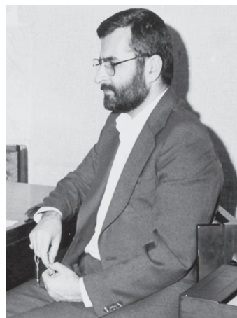
کمال خرازی آثار اعزام کاروان‌های کربلا و شرایط ایران را برای توقف جنگ اعلام کرد.

به گزارش خبرگزاری جمهوری اسلامی، دکتر خرازی ضمن تشریح تحولات ناشی از اعزام کاروان‌های راهیان کربلا به جبهه‌های جنگ تحمیلی، گفت: «اطلاعات ما از درون خاک عراق و ارتش رژیم بعث همه حاکی از وجود تزلزل روحی در ارتش و دستگاه حاکم این کشور است.» وی افزود: «همین که رژیم عراق این روزها ادعای داشتن سلاح‌های به اصطلاح خودشان تعجب‌آور می‌کند، نشان‌دهنده ترس و وحشتی است که بر بغداد مستولی است. یا وقتی ادعای احداث یک دیوار بتونی ۵۰۰ کیلومتری در برابر خطوط دفاعی خود می‌کند، این نشان‌دهنده تزلزل روحی است و بمباران‌های نمایشی و تبلیغاتی این رژیم مبنی بر تارومار کردن نیروهای ایران نیز از این منشأ می‌گیرد. اینها ابزارهایی است که رژیم بغداد برای جلوگیری از تزلزل روحی سربازانش به کار می‌گیرد.»