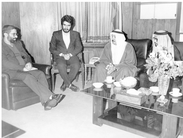
دیدار وزیر خارجه امارات با نخست وزیر

در دور دوم مذاکرات راشد عبدالله و دکتر ولایتی نیز به مسائل مهم جهان از جمله فلسطین پرداخته شد. عبدالله وضعیت فلسطین را دردآور توصیف کرد و