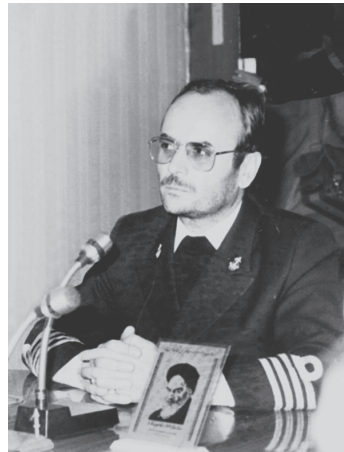
فرمانده نیروی دریایی ارتش دلایل گسترش منطقه بازرسی این نیرو را اعلام کرد.

فرمانده نیروی دریایی گفت: «نیروی دریایی کشورمان در جهت اینکه با کشورهای دوست منطقه برخوردی نداشته باشد، واحدهای خود را در خارج از تنگه هرمز مستقر کرده است تا کشتی‌های مشکوک قبل از ورود به آب‌های خلیج فارس، در آب‌های بین‌المللی مورد بازرسی قرار گیرند، لیکن اگر این کشتی‌ها به عناوین مختلف وارد آب‌های ساحلی کشورهای منطقه بشوند، با تدابیر خودمان، آنها را مجبور به خروج از این مناطق خواهیم کرد.» (۱۱)