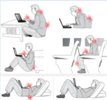
انواع پوسچرهای کار با لپ تاپ

• گویا یک تمایل ذاتی در بین کاربران این نوع وسایل دیجیتال وجود دارد که تبلت یا تلفن همراه خود را در ارتفاع سینه یا حتی پایین تر نگه می دارند. این تمایل می تواند به دلیل تلاش برای بالا نگه داشتن این وسایل به منظور حفظ محدوده ی شخصی صفحه نمایش باشد. چنین تمایلی به پوسچر نامطلوب گردن و خمش آن منجر می شود. همچنین با حرکت سر به سمت جلو، بدن پوسچری شبیه به لاک پشت به خود گرفته و تنش روی گردن بسیار افزایش می یابد. گردن در چنین پوسچر نامطلوبی برای مدت زمان طولانی تبدیل به یک عادت شده و باعث دردهای مزمن شانه و گردن و نیز خارج شدن بدن از حالت طبیعی خود می شود.